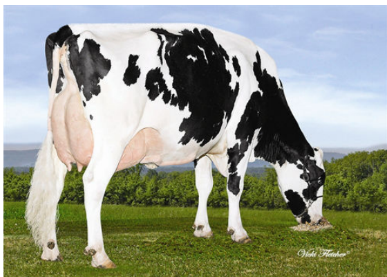
CALBRETT SHOTTLE LISAMAREE GRANDDAM